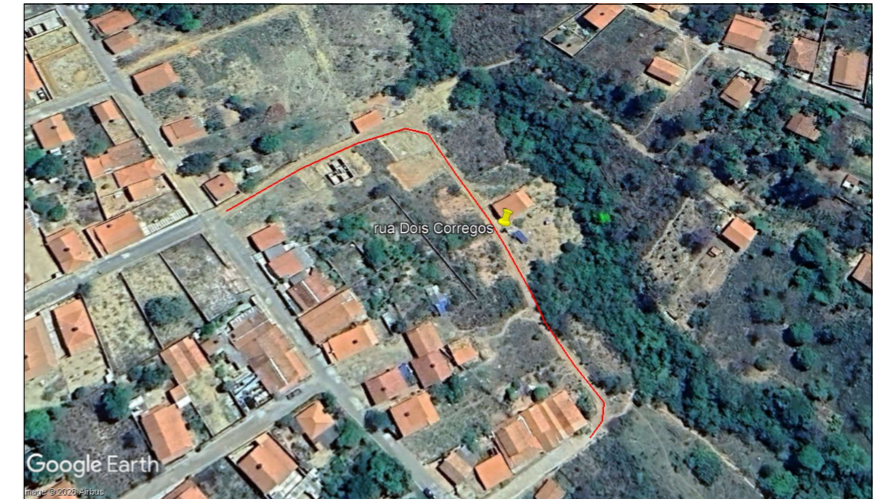
Rua Dois Córregos