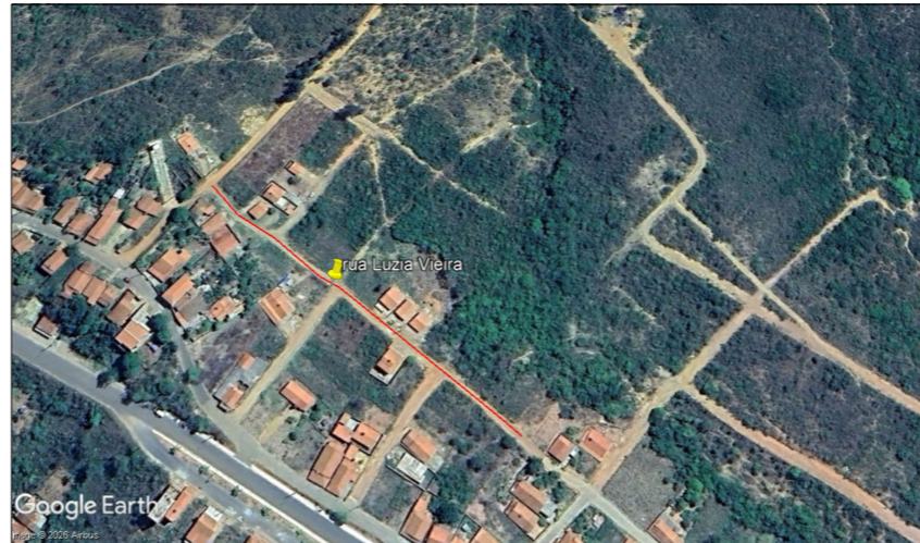
Rua Luzia Vieira