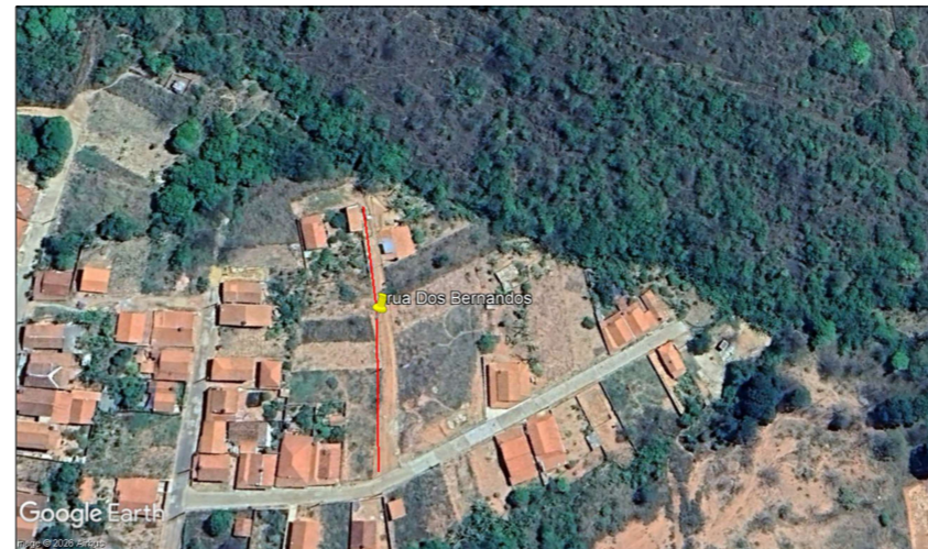
Rua Dos Bernados