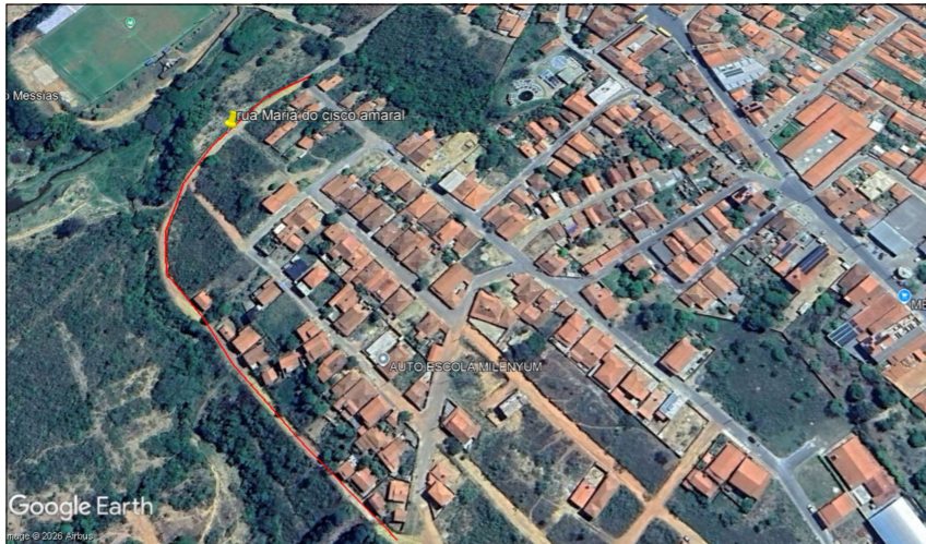
Rua Maria do Cisco Amaral