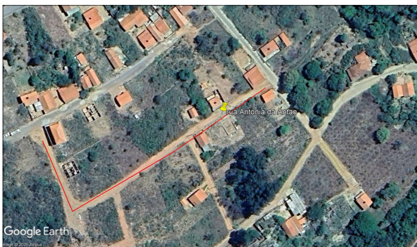
Rua Antonia do Antão