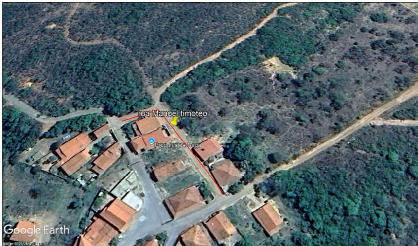
Rua Manoel Timóteo